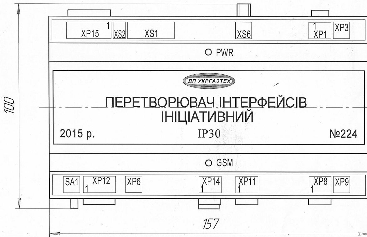
Рис. 2 - Зовнішній вигляд і найменування роз'ємів перетворювача інтерфейсів ініціативного