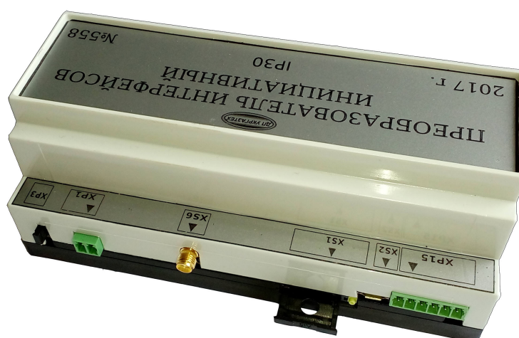
Рис. 3б - Вид перетворювача інтерфейсів ініціативного з боку підключення живлення (XP1), антени (XS6)