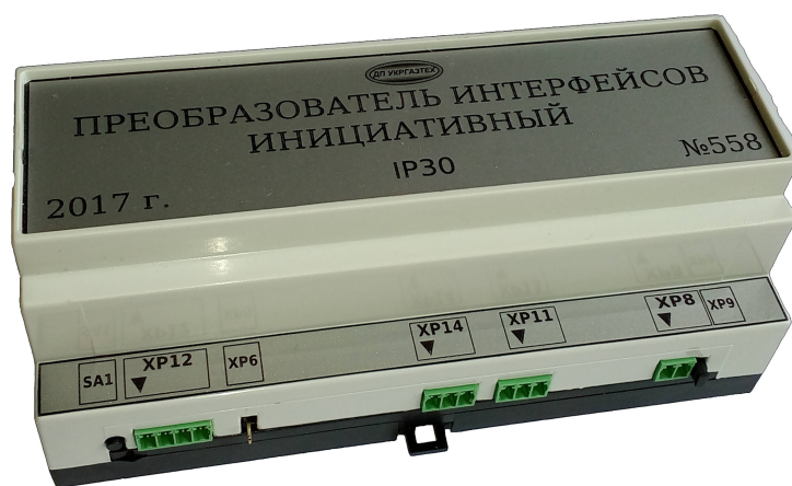
Рис. 3а - Вид перетворювача інтерфейсів ініціативного з боку основних з'єднань

Представник ВТК _____ М. П. _____ (ПІБ) _____ (підпис) _____ (дата)