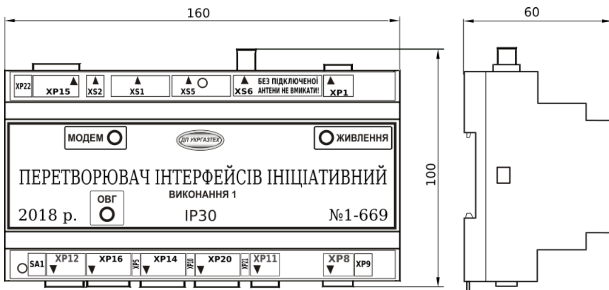
Рис. 2а - Зовнішній вигляд і найменування роз'ємів перетворювача інтерфейсів ініціативного виконання 1