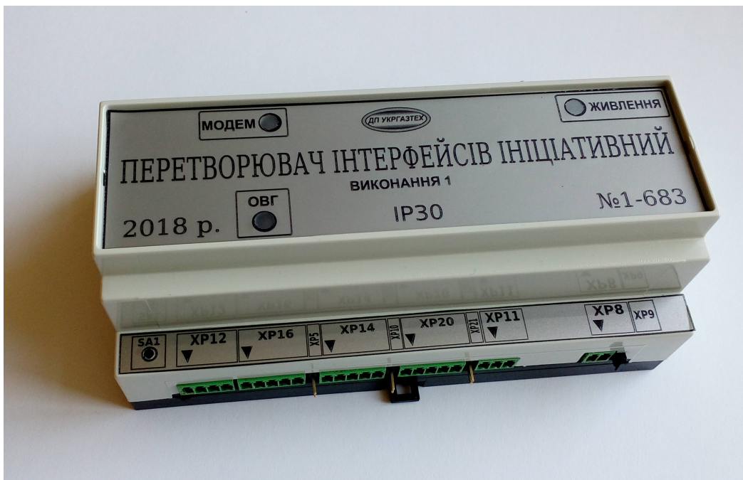
Рис. 4 - Зовнішній вигляд перетворювача інтерфейсів ініціативного виконання 1