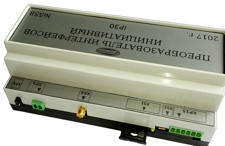
Рис. 3б - Вид перетворювача інтерфейсів ініціативного з боку підключення живлення (XP1), антени (XS6)