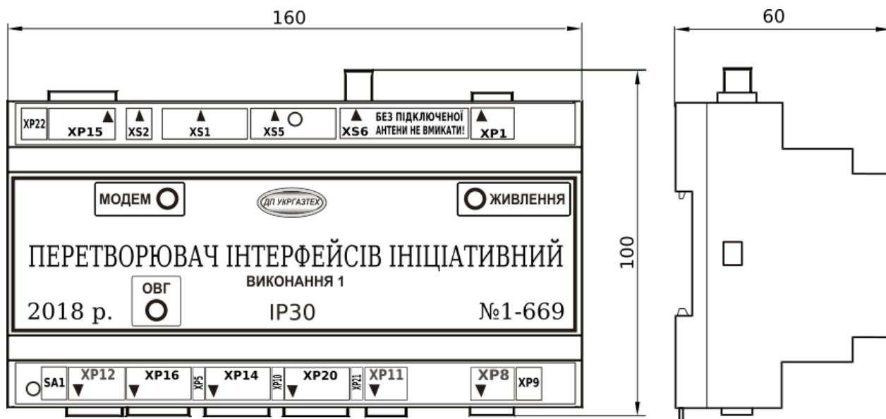
Рис. 2а - Зовнішній вигляд і найменування роз'ємів перетворювача інтерфейсів ініціативного виконання 1