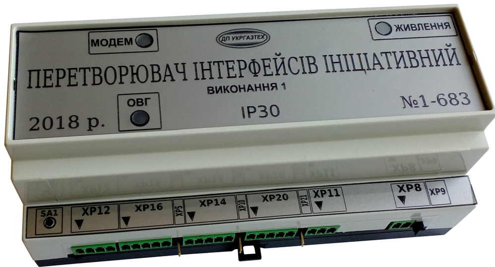
Рис. 4 - Зовнішній вигляд перетворювача інтерфейсів ініціативного виконання 1