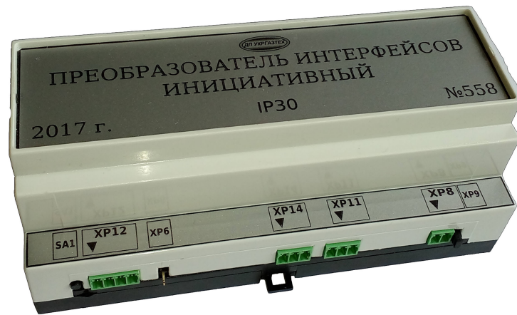
Рис. 3а - Вид перетворювача інтерфейсів ініціативного з боку основних з'єднань

Представник ВТК _____ (ПІБ) _____ (підпис) _____ (дата) М. П.