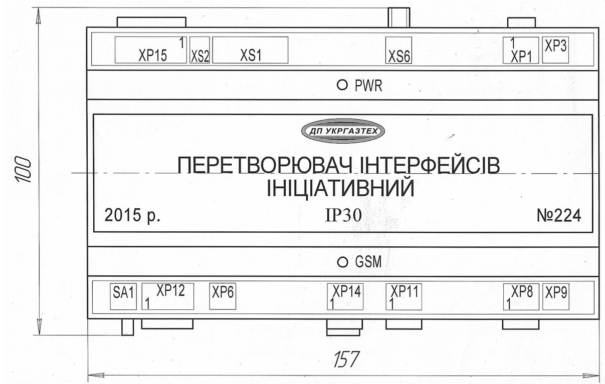
Рис. 2 - Зовнішній вигляд і найменування роз'ємів перетворювача інтерфейсів ініціативного