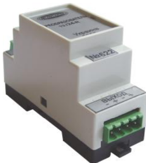
Рис. 2 Внешний вид преобразователя 12/24